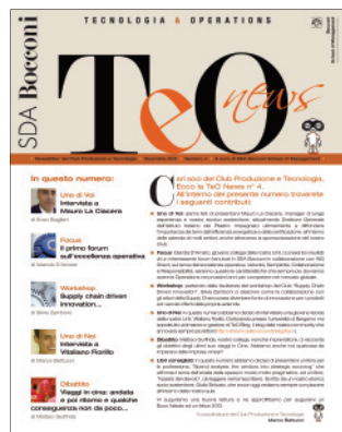
La newsletter del Club Produzione e Tecnologia

Maggiori dettagli su tutti gli eventi e sulle eventuali iniziative speciali saranno disponibili sul sito www.sdbocconi.it/clubpt